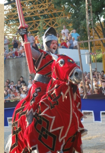
Torneo Medieval. Días 14 y 15

Cenas Medievales con actividades de animación en las Caballerizas del Castillo Calatravo. Días 13, 14 y 15