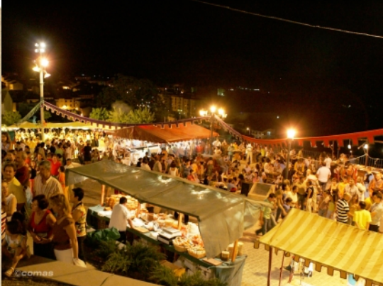
Pasacalles y Mercado Medieval 13, 14 y 15 de julio Lugar: Entorno del Castillo Calatravo

22,00 - 22,45 H: ANIMACIÓN DEL MERCADO: Luchas de caballeros, teatro callejero, música, acrobacias y títeres..